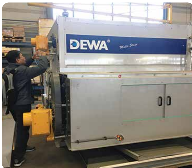
◆ Máy ép bùn cho dự án XLNT Thành phố Huế (2018)