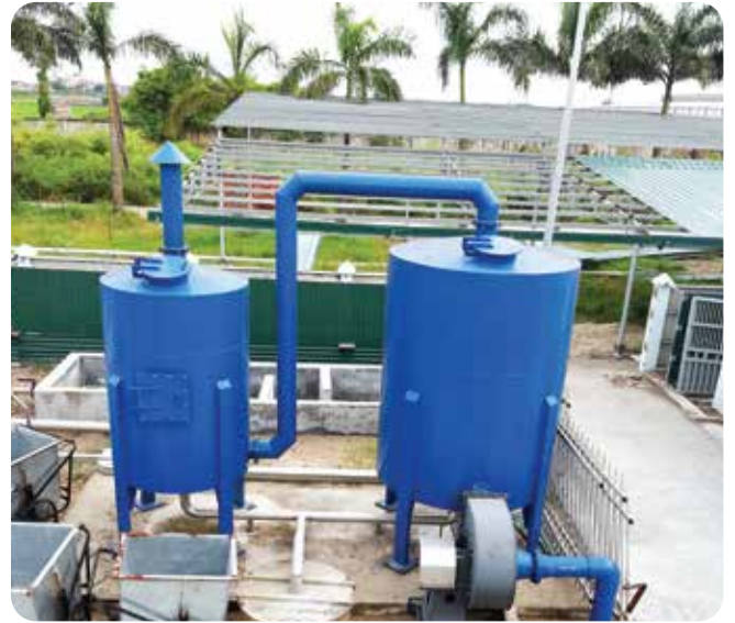
◆ Cung cấp và lắp đặt hệ thống khử mùi cho dự án Xử lý nước thải thành phố Ninh Bình, 2000 m 3 /giờ