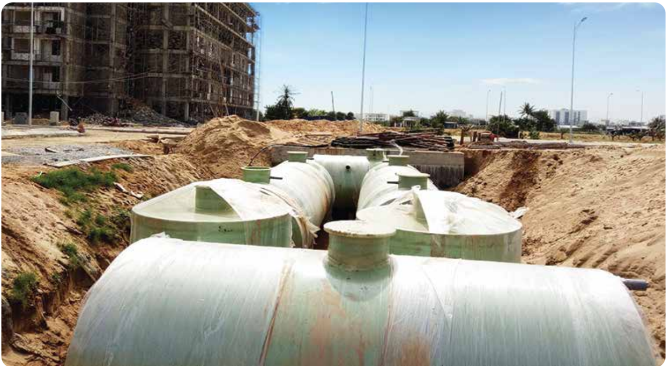
◆ Cung cấp và lắp đặt hệ thống xử lý nước thải hợp khối cho dự án Điện Hạt nhân, tỉnh Ninh Thuận (2016)