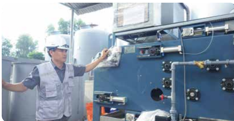
◆ Nhà máy nước thải Sông Công, tỉnh Thái Nguyên (2015)