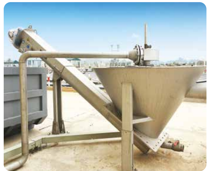
◆ Cung cấp và lắp đặt thiết bị công nghệ, cơ điện cho nhà máy xử lý nước thải thị xã Bỉm Sơn, tỉnh Thanh Hóa - CS Giai đoạn 1: 3500 m 3 / ngày (2016)