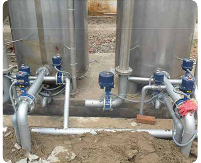
◆ Trạm xử lý nước ngầm, Bệnh viện 74 Trung ương, thị xã Phúc Yên, tỉnh Vĩnh Phúc